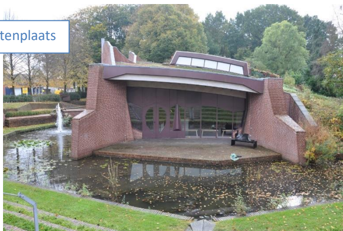
Museum de Buitenplaats

Als u met de rug naar de ingang staat gaat u links op de 'Hoofdweg'. Tweede straat RA 'Drostweg'. 1 e LA 'Schultenweg'. Einde RA 'Duinerlaan'. Kruising RD over onverhard pad. Grote weg 'Burgermeester Legroweg' oversteken en pad vervolgen.