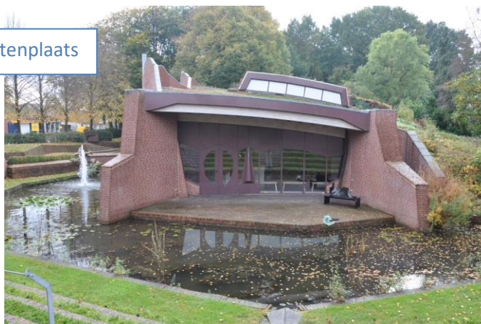
Museum de Buitenplaats

Als u met de rug naar de ingang staat gaat u links op de 'Hoofdstraat'. Tweede straat RA 'Drostweg'. 1 e LA 'Schultenweg'. Einde RA 'Duinerlaan'. Kruising RD over onverhard pad. Grote weg 'Burgermeester Legroweg' oversteken en pad vervolgen.