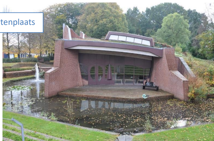
Museum de Buitenplaats

Als u met de rug naar de ingang staat gaat u links op de 'Hoofdweg'. Tweede straat RA 'Drostweg'. 1 e LA 'Schultenweg'. Einde RA 'Duinerlaan'. Kruising RD over onverhard pad. Grote weg 'Burgermeester Legroweg' oversteken en pad vervolgen.